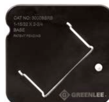
3000SSRB Canalisation série 3000 Legrand 37 mm x 70 mm (1-15/32 po x 2-3/4 po) (base)