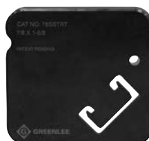
78SSTRT Profilé 22 mm x 41 mm (7/8 po x 1-5/8 po)