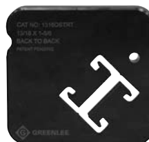
1316DSTRT Profilé dos-à-dos 21 mm (13/16 po)