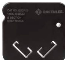
GSDR15 Rail DIN – Section G