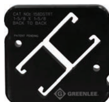
158DSTRT Profilé dos-à-dos 41 mm x 83 mm (1-5/8 po x 3-1/4 po)