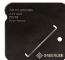
3000SSRC Canalisation série 3000 Legrand 70 mm (2-3/4 po) (couvercle)