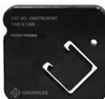
158STRDSTRT Profilé 41 mm x 41 mm (1-5/8 po x 1-5/8 po)