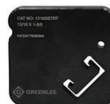
1316SSTRT Profilé 21 mm x 41 mm (13/16 po x 1-5/8 po)