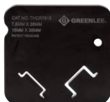
THDR7515 Combinaison matrice/rail DIN à profilé chapeau 7,5 mm et 15 mm x 35 mm