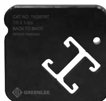
78DSTRT Profilé dos-à-dos 22 mm (7/8 po)