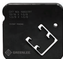
158SSTRT Profilé double 41 mm x 41 mm (1-5/8 po x 1-5/8 po) et 41 mm x 21 mm (1-5/8 po x 13/16 po)