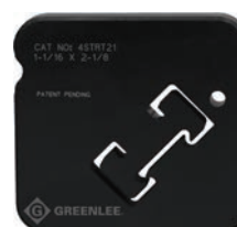
4STRT21 Profilé Cooper B-Line® 4D21 54 mm x 27 mm (2-1/8 po x 1-1/16 po)