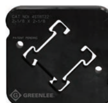
4STRT22 Profilé Cooper B-Line® 4D22 54 mm x 54 mm (2-1/8 po x 2-1/8 po)