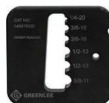
1458TROD Tige filetée 6 mm (1/4 po), 10 mm (3/8 po), 13 mm (1/2 po), 16 mm (5/8 po)